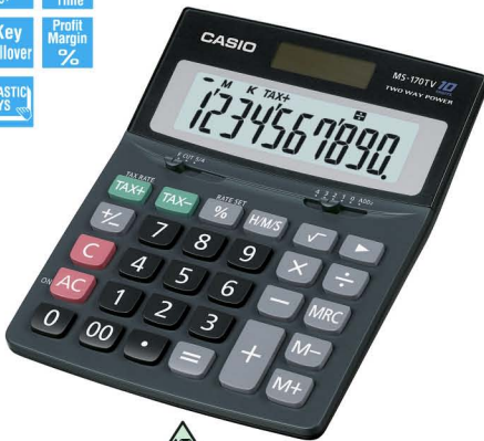
MS-170TV 10 DIGITS