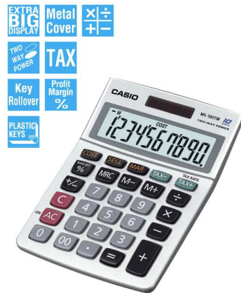
MS-100TM 10 DIGITS

Easily figure cost, selling price and margin. Calcula fácilmente el costo, precio de venta y margen de ganancia.