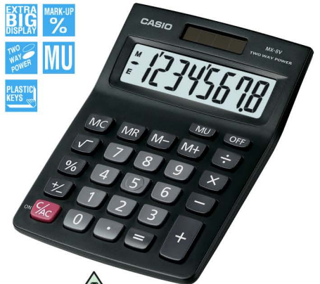
MX-8V 8 DIGITS