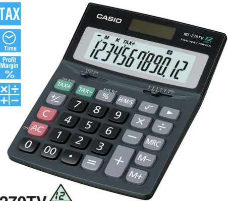
MS-270TV 12 DIGITS