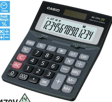
MS-470V 14 DIGITS