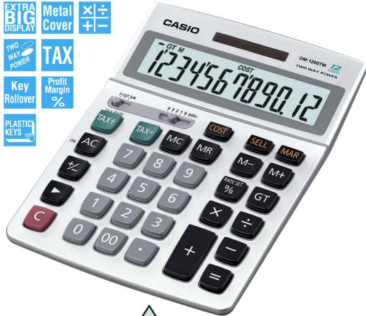
DM-1200TM 12 DIGITS