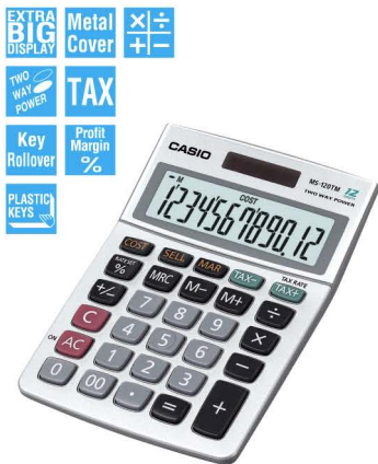
MS-120TM 12 DIGITS