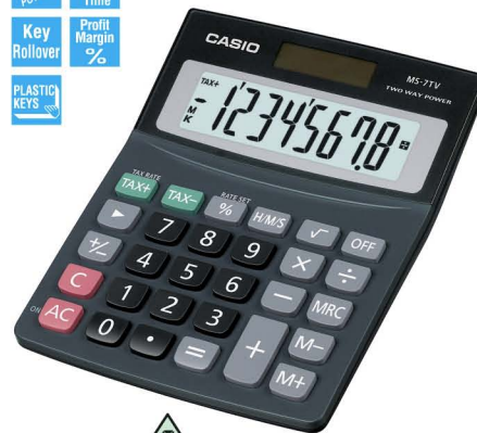
MS-7TV 8 DIGITS