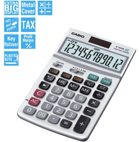
JF-120TM 12 DIGITS